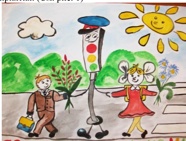
Рисунок 1. Иллюстрация к занятию