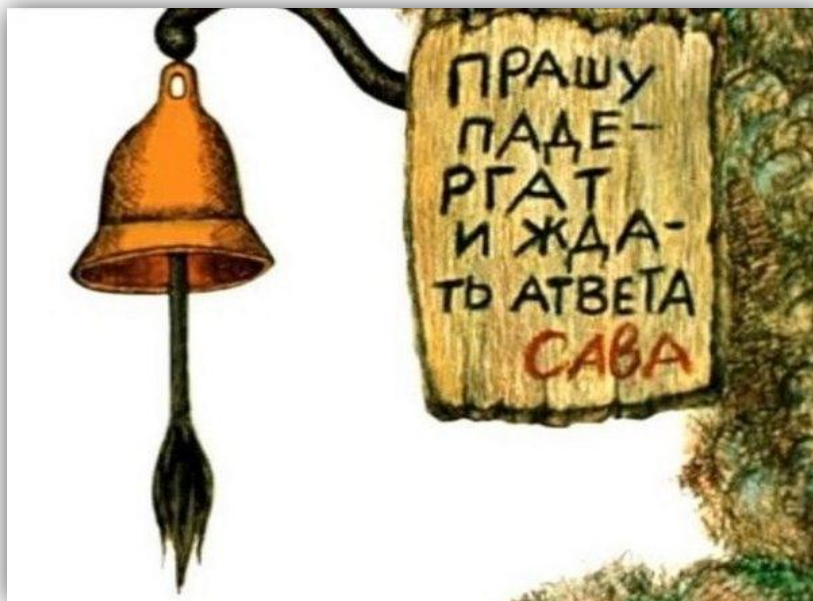
Рисунок 1. Мануал для входа

Если рисунок/диаграмма заимствована из официальных источников (журнал, монография, автореферат диссертации, официальный сайт организации и т.п.), необходимо сделать ссылку.